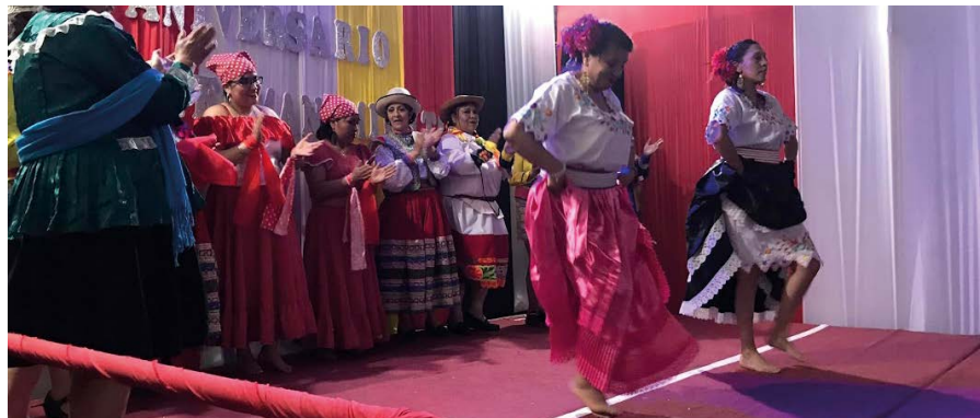
▲ ... Musik und traditionellen Tänzen | ... música y bailes tradicionales.

Kurz vor Ende des Jahres schaue ich auf alles zurück, was ich mit so viel Mühe und Erfolg geleistet habe. Und ich bin dankbar für das unendliche