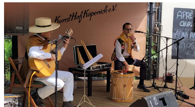
◀ Gitarre, Panflöte, Cajon und mehr: das peruanische Duo Alma Andina | Guitarra, flautas de pan, cajón y más: el duo peruano Alma Andina

boren. Auf dem Weg von den ersten Planungen im Oktober 2022 bis zur Umsetzung im Mai 2023 hieß es für uns das eine oder andere Mal: Nerven behalten und Hürden aus dem Weg räumen. Geeignete peruanische Musikerinnen bzw. Musiker wollten ebenso gefunden werden wie die notwendigen Gelder, und kleinere Missverständnisse in der Kommunikation mussten ausgeräumt werden. Am 21. Mai – fast genau auf den Tag 25 Jahre nach der Unterzeichnung der