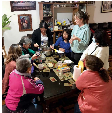
▲ Cajamarca feiert das Jubiläum mit Gästen,... | Cajamarca está celebrando el aniversario con huéspedes, ...

Zu all den durchgeführten Feierlichkeiten gehörte auch der erste Jahrestag des Handarbeits-Kiezklubs „Freundschaft, Farbe und Kunst“, an dem alle zugehörigen Damen, die mittlerweile eng befreundet sind, einen Ausflug zu einer bekannten Farm in Cajamarca machten, wo eine wunderbare Torte auf sie wartete. Wir